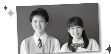
(企画・制作/産経アドス)

内容は、各校により異なります。自分に合った高校を選ぶためには、オープンスクールなどに参加して、積極的に情報収集するのがおすすめ。できれば各校の担当者に、直接話を聞いてみましょう。